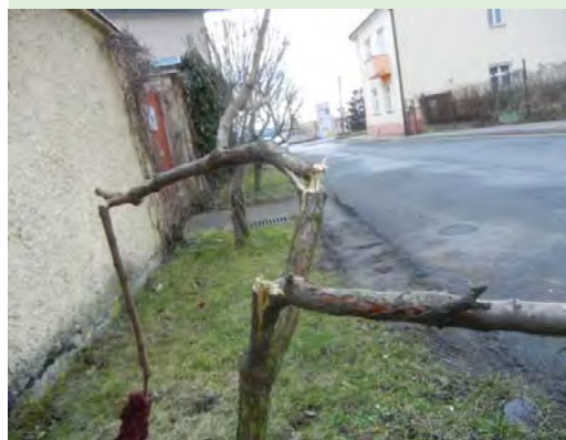
Polámaná výsadba v Krokově ulici

na Komisi městské části se v poslední době často obrací lidé upozorňující na, řekněme, jisté nešvary svých sousedů vůči nim samotným, životnímu prostředí nebo čemukoliv jinému.